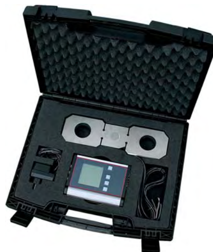
Fittingcase Tension load cell and Amplifier for strain gauge Zubehörkoffer Zugkraftzelle und DMS-Messverstärker